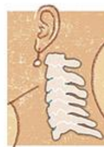
Właściwe ustawienie kręgow szyjnych

Zwykle siedząc przy biurku przechylamy szyję oraz obręcz barkową do przodu w kierunku klawiatury, lub przechylamy szyję w bok podczas rozmowy telefonicznej. Wymuszona pozycja mięśni szyi może prowadzić do stałego zaburzenia kręgow szyjnych.