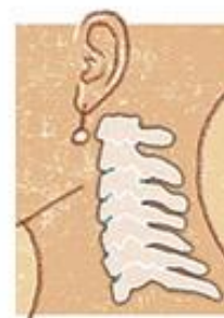
Właściwe ustawienie kręgów szyjnych

Zwykle siedząc przy biurku przechylamy szyję oraz obręcz barkową do przodu w kierunku klawiatury, lub przechylamy szyję w bok podczas rozmowy telefonicznej. Wymuszona pozycja mięśni szyi może prowadzić do stałego zaburzenia kręgow szyjnych.